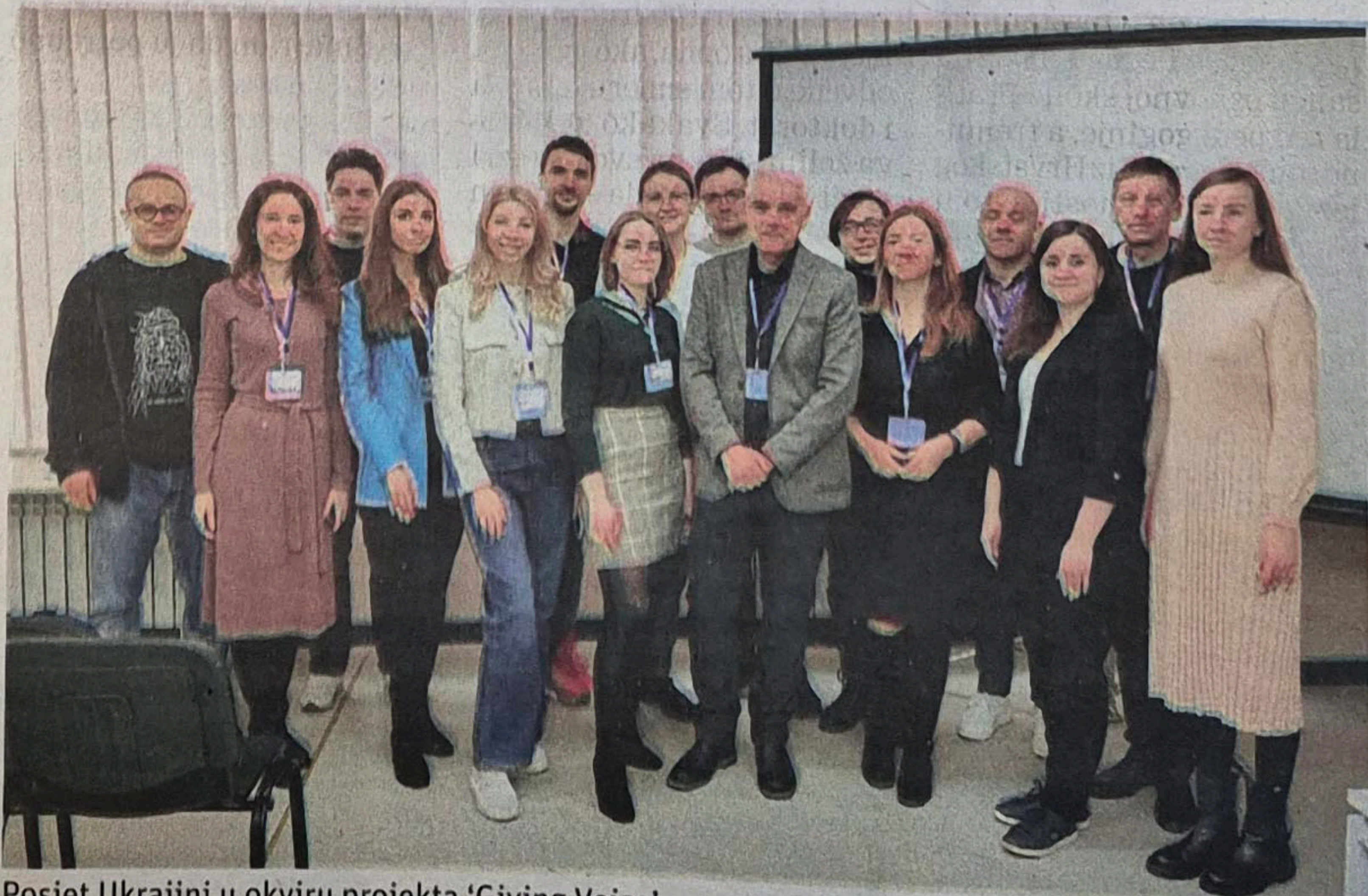
Posjet Ukrajini u okviru projekta 'Giving Voice'

ma. Ljudi u tim gradovima pokušavaju živjeti normalno. Jasno je da se radi o prividu, jer uz sirene i česta raketiranja nema normalnog života. Ono što je očito iz svih ostvarenih kontakata je snažna kohezija društva jednaka onoj koje se sjećamo iz Domovinskog rata. Za ljude u Ukrajini postoji samo jedna istina, a to je da netko drugi želi izbrišati njihovu državu, identitet, jezik, kulturu. Za one koji još ne znaju tamo nema nacista, američkih špijuna koji ih guraju u rat